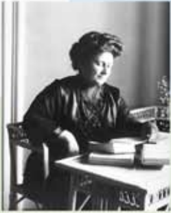
Maria Montessori ist Ärztin und Pädagogin und Gründerin des „Casa dei Bambini“ in Rom